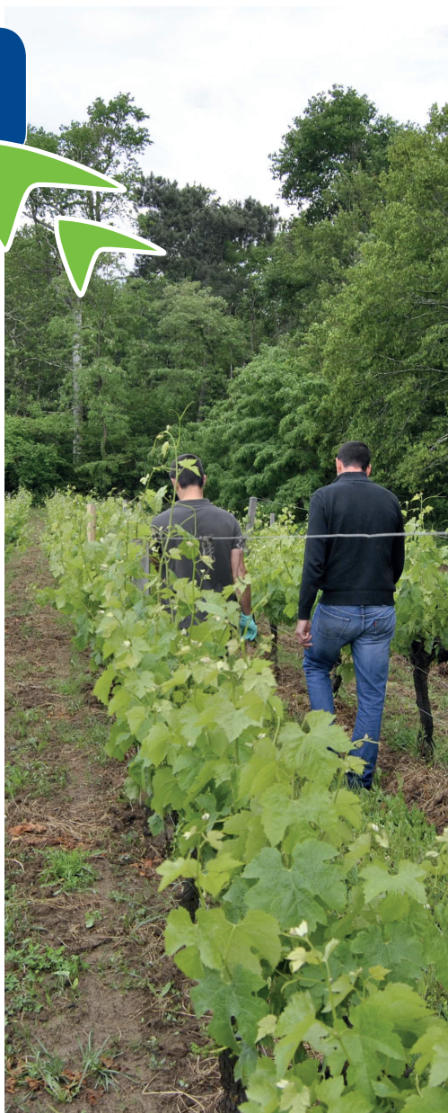
Réalisé et imprimé par PAO/CA 33 - Septembre 2017

Chambre d'Agriculture de la Gironde Service Vigne et Vin Vinopôle Bordeaux-Aquitaine 39 rue Michel Montaigne - CS 20115 33295 Blanquefort Cedex Tél. 05 56 35 00 00 vigne-vin@gironde.chambagri.fr www.gironde.chambagri.fr